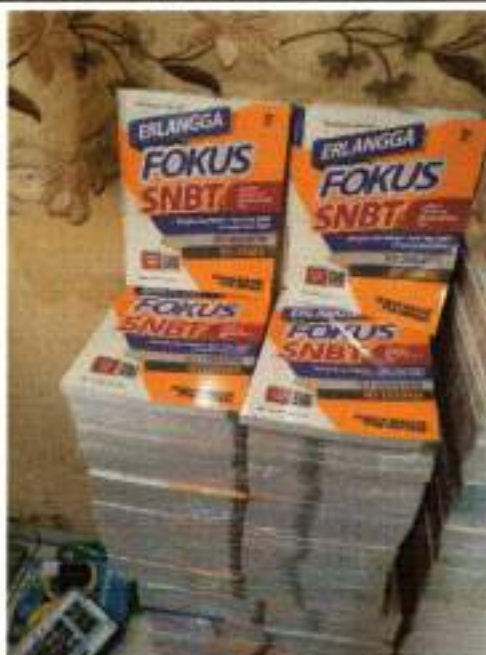
Lampiran BAST Pertama

https://siplah.blibli.com/backend/order-doc/S10004538862/digital-bast