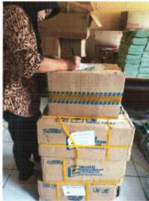
Lampiran BAST Pertama

https://siplah.blibli.com/backend/order-doc/S10004908625/digital-bast