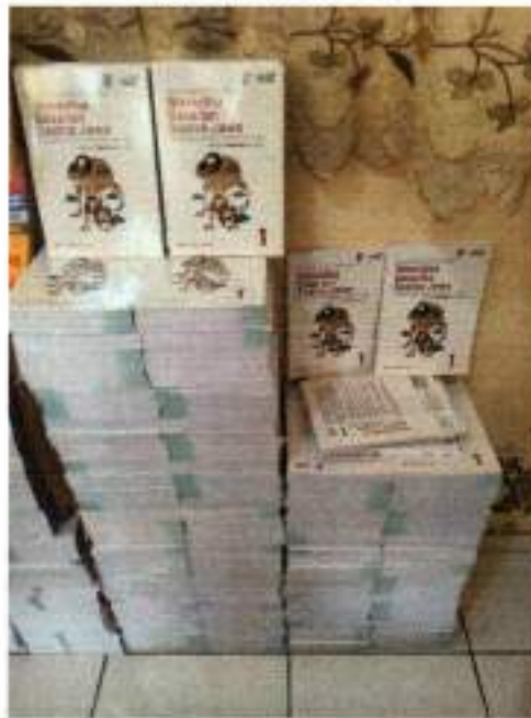
Lampiran BAST Pertama

https://siplah.blibli.com/backend/order-doc/S10004560749/digital-bast