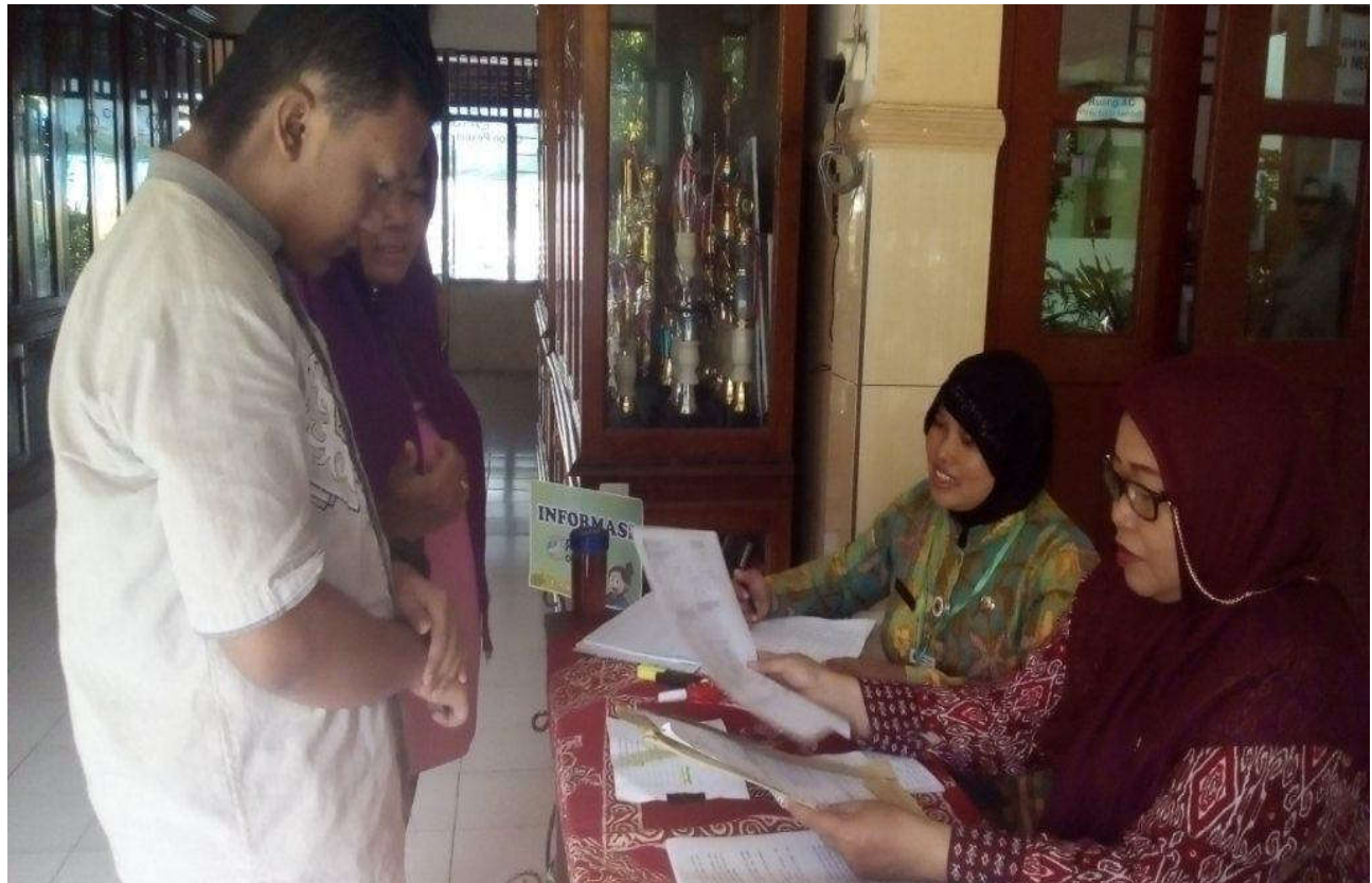
Bagian Informasi PPDB