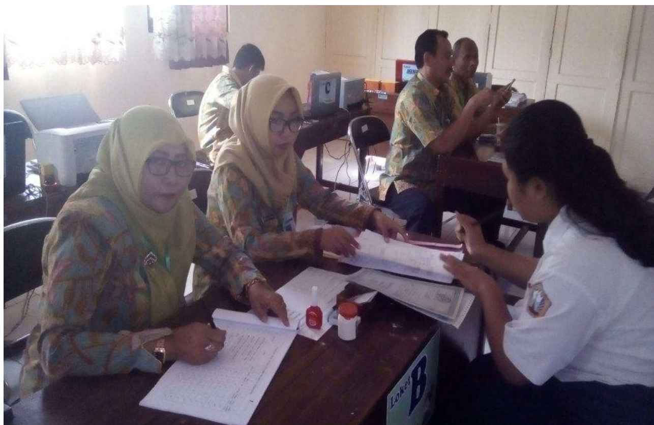
Loket Pengecekan Kelengkapan Berkas dan Operator Verifikasi Berkas